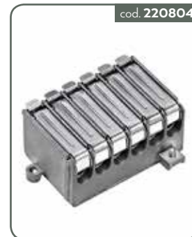
PP4 PARTITORE 4 VIE