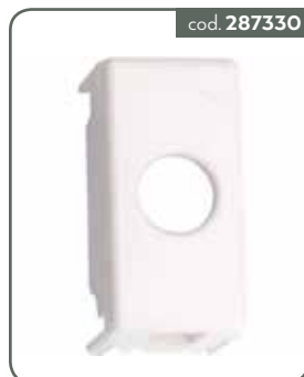
VI-PL ADAT SIN VIM PLANA BIA