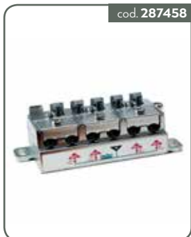
PA5M PART 5 OUT 5-2400 MOR