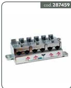
DE110M DER 1 OUT 5-2400 10DB MOR