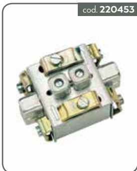
CAD14 CASSETTA DI DERIVAZIONE