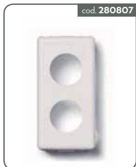
BT-MAT2 ADATT. PRESE DEMIX