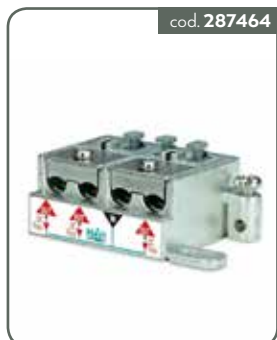
DE412M DER 4 OUT 5-2400 12DB MOR