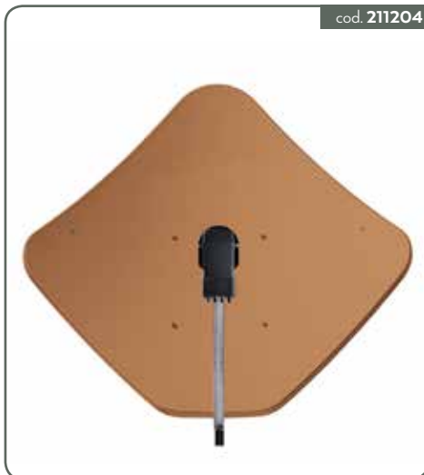
PENTA 85-A ANTENNA PARABOLICA