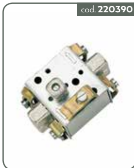
CAD11 CASSETTA DI DERIVAZIONE