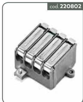
PP2 PARTITORE 2 VIE