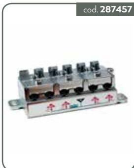
PA4M PART 4 OUT 5-2400 MOR