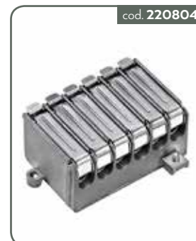
PP4 PARTITORE 4 VIE