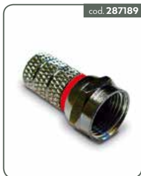
CF50B CONN.F AVVITARE 5,0MM