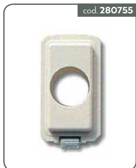
BT-MA ADAT SIN TIC MAGIC AVO