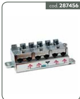
PA3M PART 3 OUT 5-2400 MOR