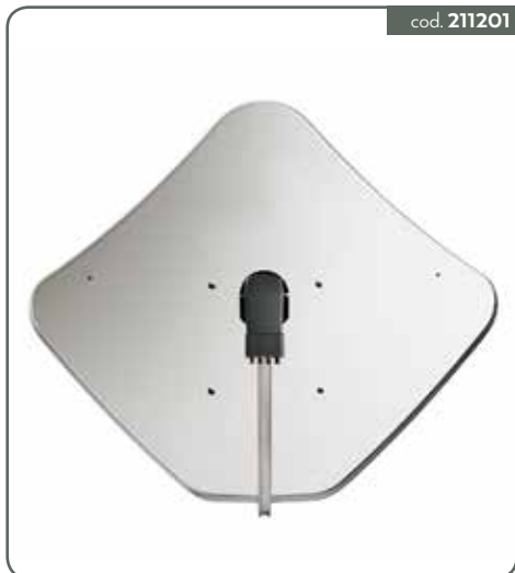
PENTA 85R ANTENNA PARABOLICA