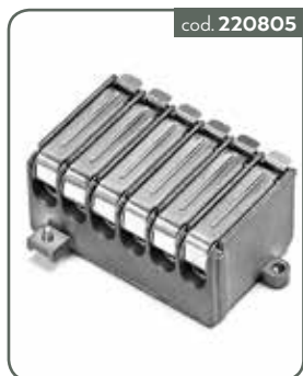
PP5 PARTITORE 5 VIE