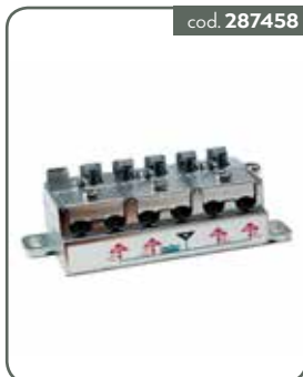
PA5M PART 5 OUT 5-2400 MOR