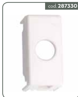
VI-ARK-W ADAT SIN VIMARKWHIT BIA