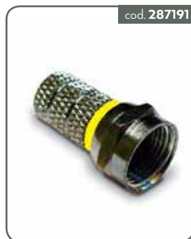
CF66B CONN.F AVVITARE 6,6MM