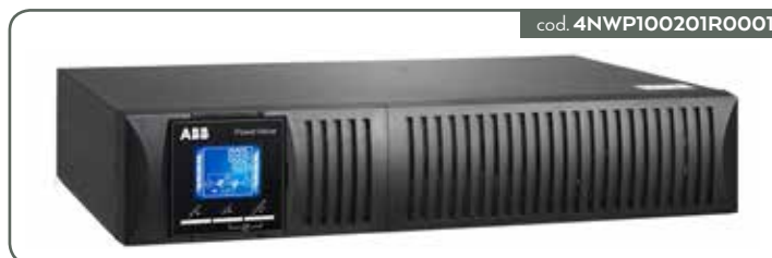
UPS POWERVALUE 11RT G2 2KVA B