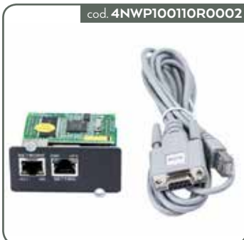
SCHEDA WINPOWER MODBUS 11T/RT G2 6-10KVA (PER 11T G2 E RT G2 6-10KVA)