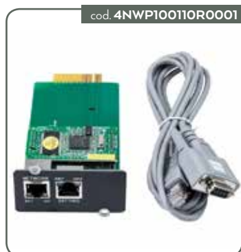
SCHEDA WINPOWER SNMP 11T/RT G2 6-10KVA (PER 11TG2 E RT G2 6-10KVA)