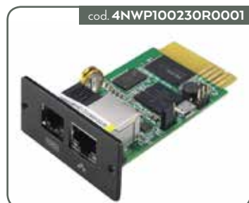
SCHEDA WEB PRO SNMP (PER 11RT G2 1-3 KVA)