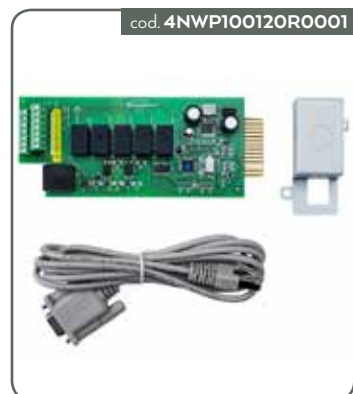
SCHEDA RELE AS400 11T ERT G2 6-10KVA (PER 11TG2 E RT G2 6-10KVA)