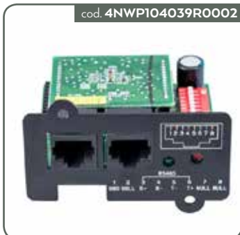
SCHEDA MINI WINPOWER PV 11T G2 1-3KVA (PER 11T G2 1-3KVA INCLUSO CEI016)