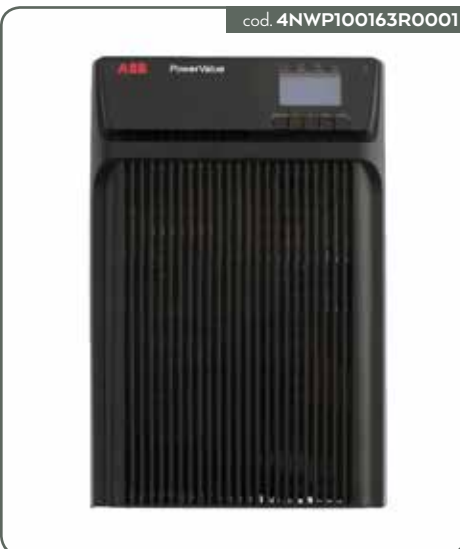
UPS POWERVALUE 11T G2 10 KVA B