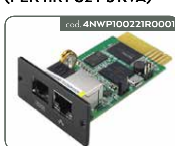
SCHEDA WEB PRO MODBUS (PER 11RT G2 1-3 KVA)