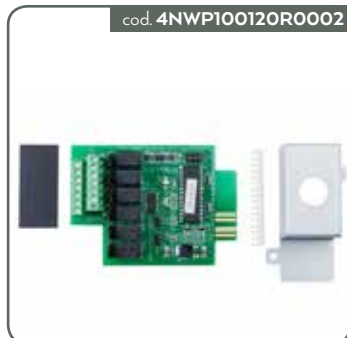
SCHEDA MODBUS MINI WINPOWER PV 11T G2 1-3KVA (PER 11T G2 1-3KVA INCLUSO CEI016)