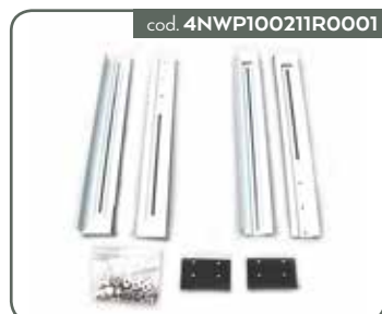
KIT MONTAGGIO SU RACK 11RT G2 1-3 KVA