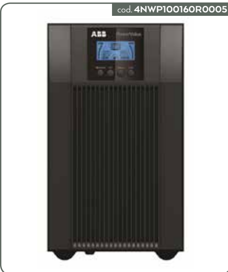
UPS POWERVALUE 11T G2 2 KVA CE I 016