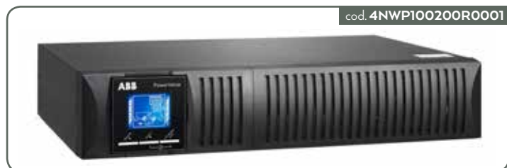
UPS POWERVALUE 11RT G2 1KVA B